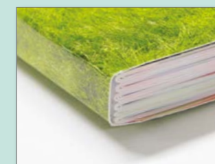
Brossura filo refe